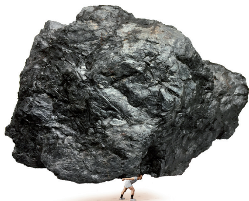
Mineur du dimanche ramenant du boulot à la maison

Dans le cadre de la biennale ARTour , le Centre Daily-Bul & C° est heureux d'accueillir une série d'œuvres du collectif suisse évoquant de manière impertinente la thématique D'un temps à l'autre .